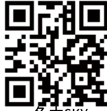
名大SKY ホームページ