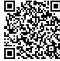
アン小学生テスト お申込みページ