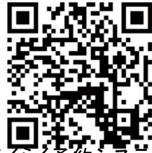
らくらく予約システム マイページ